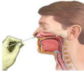
Hình 3: Lấy mẫu dịch ngoáy mũi