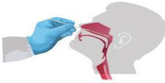
Hình 1: Lấy mẫu ngoáy dịch ty hầu